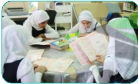
هن يقرآن القصص

٢ أعر عن الصور الآتية بجمل مفيدة باستخدام ضمائر الغائب (هو . هي . هم . هن):