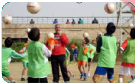
هم يلعبون بالكرة