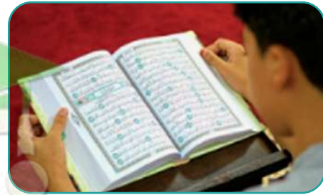
هو يقرأ القرآن