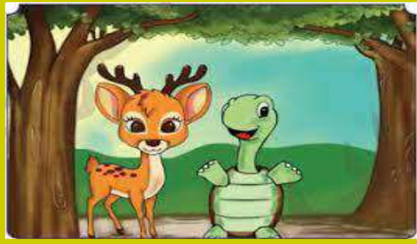
رابط الغزال والسلحفاة