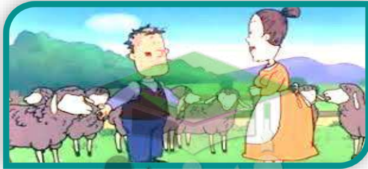
رابط السيدة البخيلة والخروف

https://www.youtube.com/watch?v=3-KXKKD96Ao