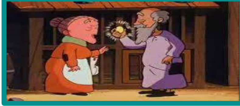
رابط الدجاجة والبيض الذهبي

https://www.youtube.com/watch?v=hkD0SQnGgSo