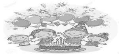
Image ( 4 )

Je dois aller au supermarché pour faire des courses. J'ai besoins d'une douzaine d'œufs, Un kilo de tomates. Une bouteille de jus et un paquet de chocolat.