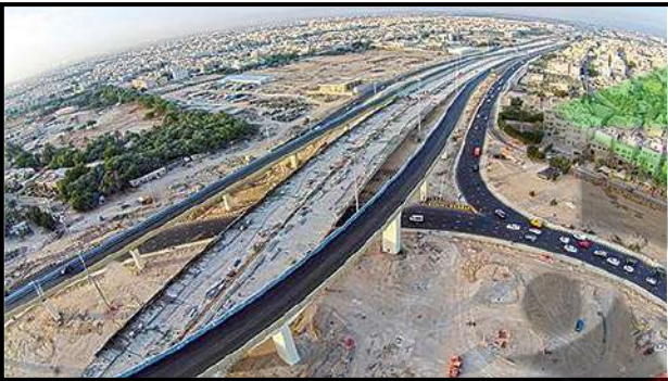
( مشروع طريق الجهراء )