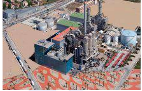
( مشروع معالجة النفايات الصلبة )