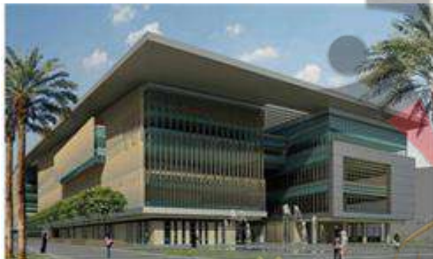
( مشروع مبنى الجامعة الجديد )