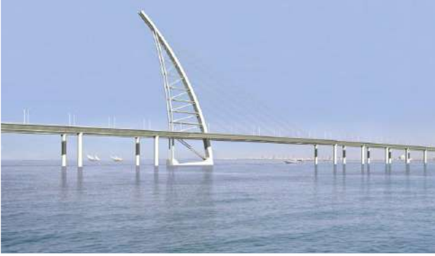
( جسر الشيخ جابر )