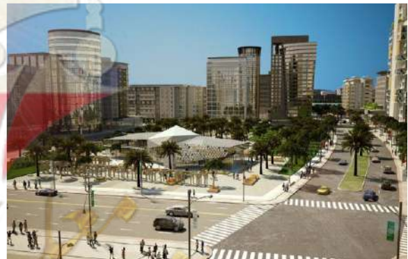
( مدينة جنوب المطلاع )