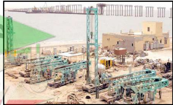
( مشروع ميناء مبارك الكبير )