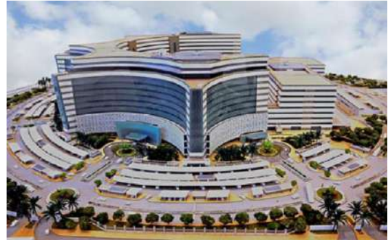
( مستشفى الجابر )