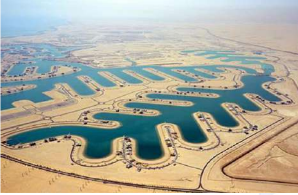
( مدينة صباح الأحمد البحرية )