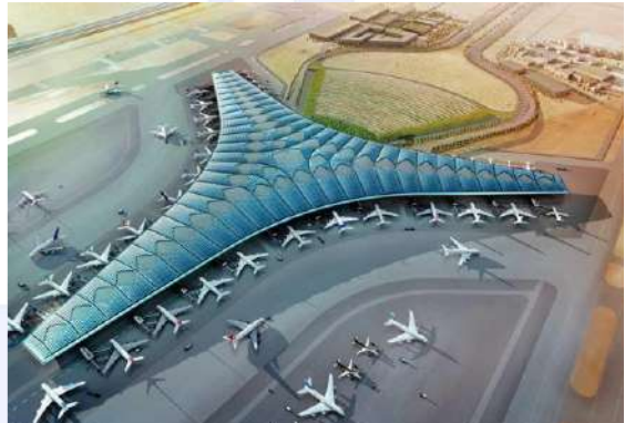
( مشروع المطار الجديد )