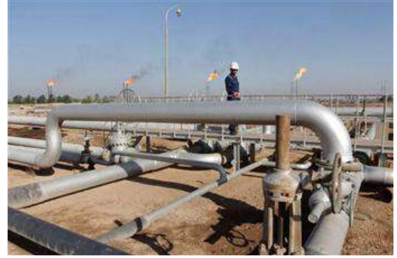
( مشروع مصفاة الزور )