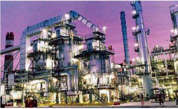
( مشروع مبادرة القود البيئي )