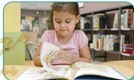
هي تقرأ الكتاب