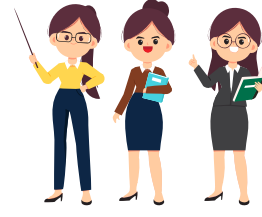
أُنتن معلمات رائعات