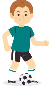
أنتَ طفل رياضي

٥ أعبّر عن الصور الآتية بجمل مفيدة باستخدام ضمائر المخاطب (أنت، أنتِ، أُنتم، أُنتن):