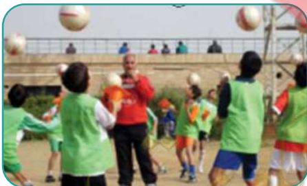
هم يلعبون بالكرة