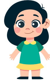
أنتِ فتاة جميلة