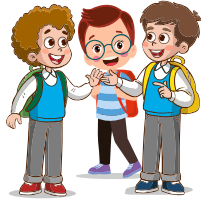
أُنتم طلاب مميّزون