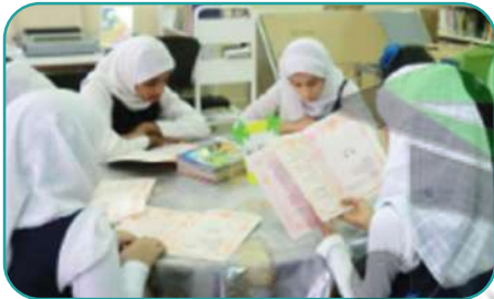
هن يقرآن القصص

٢ أعر عن الصور الآتية بجمل مفيدة باستخدام ضمائر الغائب (هو . هي . هم . هن) :