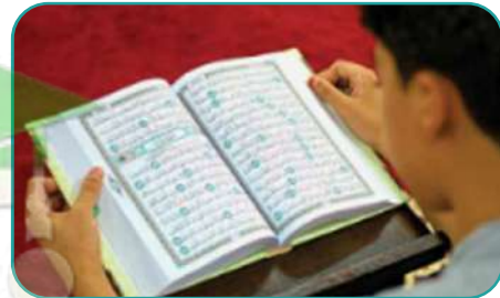
هو يقرأ القرآن