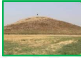
مرتفع يشبه الجبل، ولكنه أصغر منه (تل جبال الزور - بركان - تل وارة)