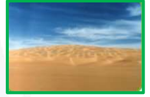
مساحة واسعة من الأرض المنبسطة (سهل الدبدبة)