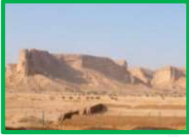
منطقة مرتفعة وقمتها مستوية (هضبة الأحمدى)