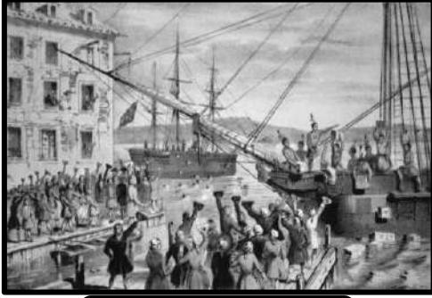
حفلة شاي بوسطن

- في مساء 16 سبتمبر عام 1773م تنكر عدد من الأمريكيين في زي عمال الهنود الحمر وتسللوا إلى ميناء بوسطن حيث كانت هناك ثلاث سفن إنجليزية محملة بالشاي فقاموا بإلقاء حمولتها في البحر مما أثار هذا العمل غضب البرلمان الإنجليزي وأعلن أن منطقة بوسطن منطقة اضطرابات وتم إصدار القوانين الجائرة لمعاقبة بوسطن.