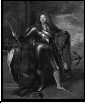
الملك جيمس الثاني