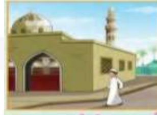
الذهاب مبكراً إلى المسجد