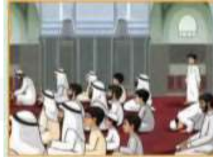
لا يتخطى أحداً ويجلس حيث وجد مكاناً