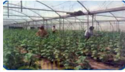
الزراعة في بيوت بلاستيكية