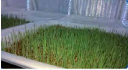
الزراعة بدون تربة

س: ضع عنواناً مناسباً للصور والأشكال التالية: