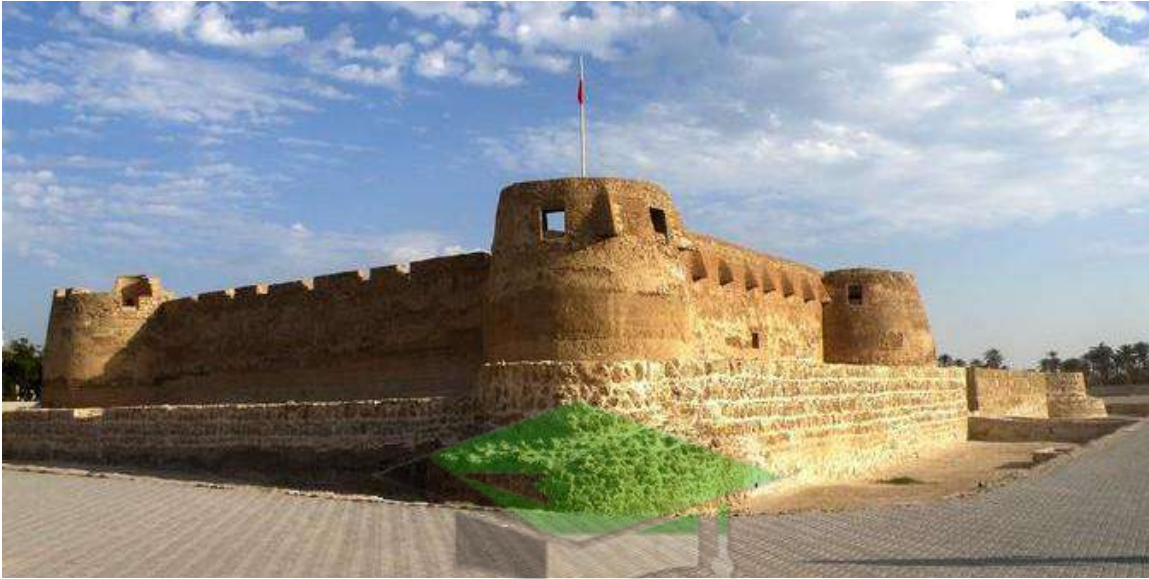
شكل ( 1 ) : يوضح حضارة دلمون القديمة في البحرين

للخليج العربي دور كبير في التاريخ القديم ، حيث سمي قديماً بالبحر الأدنى أو بحر شروق الشمس ، تعتبر حضارة دلمون من الحضارات القديمة التي تقع في الجزء الشرقي من شبه الجزيرة العربية ، وهي من أقدم الحضارات في العالم ، وقد وصفها القدماء أنها المكان الذي تشرق منه الشمس ، ووصفوها أنها أرض الأحياء ، كان أرخبيل البحرين مقر عاصمة الدلمون القديمة ، وقد سمح هذا الموقع الاستراتيجي بأن تتطور هذه الحضارة لتصبح مركزاً هاماً للتجارة في قديم الزمان ، حيث أن الخليج العربي بشكل عام كان ملتقى الحضارات الكبرى في الشرق الأوسط .