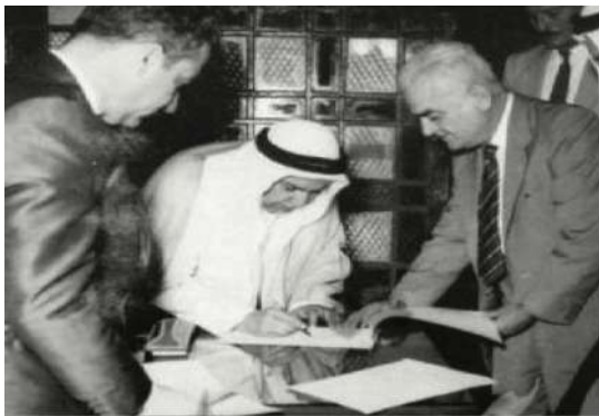
شكل رقم (٢٤) يوضح: الشيخ عبدالله السالم يوقع على الدستور.

( بم تفسر : الأسباب التي دعت الشيخ عبد الله السالم لوضع الدستور ؟ )