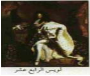
لويس الرابع عشر