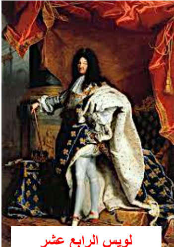
لويس الرابع عشر

ولكن جميع نواب العامة كانوا حول ميرابو وأطلقوا علي أنفسهم اسم ( الجمعية الوطنية )