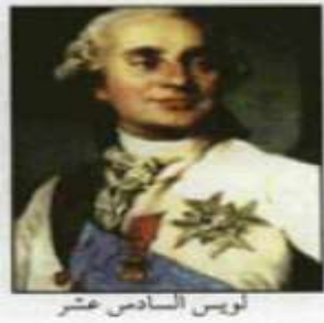
لويس السادس عشر