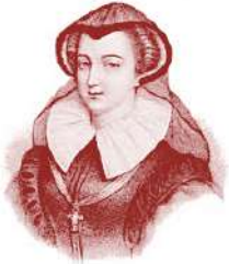
الملكة ماري الثانية