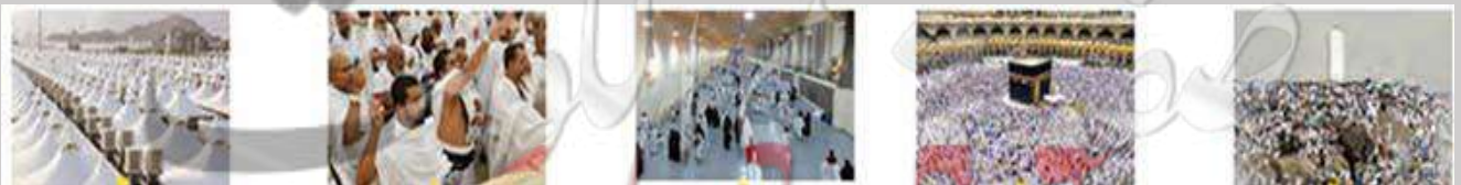
الوقوف بعرفة الطواف السعي بين الصفا والمروة رمي الجمرات المبيت في منى