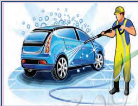
عدم الإسراف في المياه