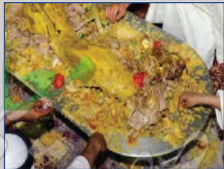
عدم الإسراف في الطعام