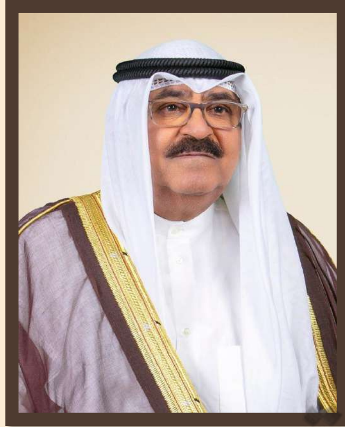
السمو الشيخ مشعل أحمد الجابر الصباح ولي عهد دولة الكويت