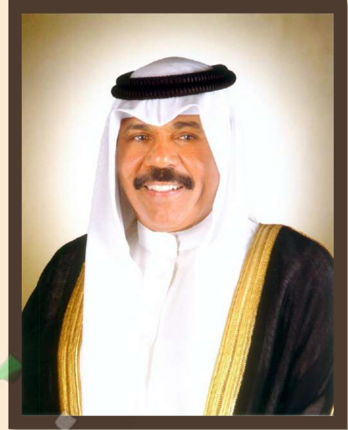
صاحب سمو الشيخ نواف أحمد الجابر الصباح أمير دولة الكويت